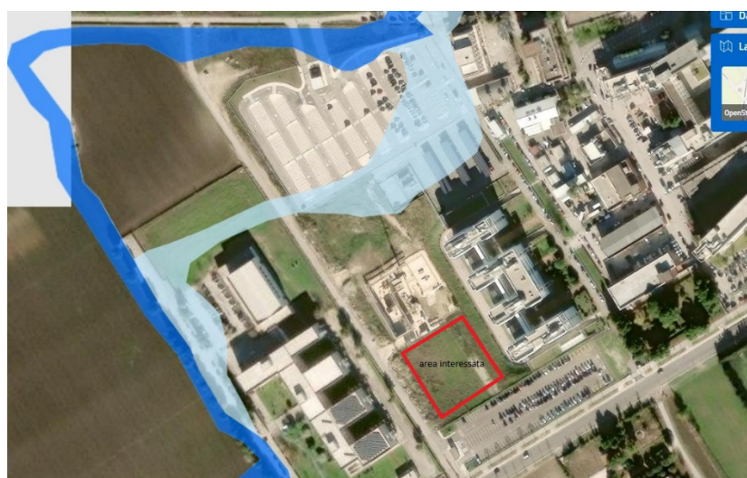
Figura 1 - Vincolistica AdB

Sotto il profilo dei vincoli, l'area ricade all'interno delle superfici di limitazione degli ostacoli (c.d. cono di volo) dell'aeroporto "Gino Lisa". Non si evidenziano, invece, vincoli ostatici diretti di natura archeologica o paesaggistica, fermo restando il necessario rispetto delle distanze e delle fasce di rispetto previste dagli strumenti urbanistici e aeronautici vigenti.